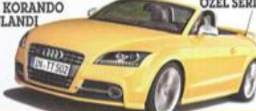
AUDI TT ÖZEL SERİ