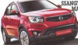
SSANGYONG KORANDO MAKYAJLANDI