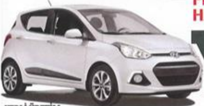
YERLİ ÜRETİM HYUNDAI i10 CADILLAC ELMIRAJ

FRANKFURT 2013 YAKLAŞIRKEN BOMBA HABERLER SADECE ALMANLAR'DAN GELMİYOR!