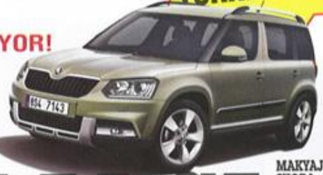
MAKYAJLI SKODA YETİ